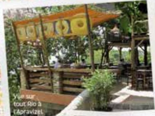
Vue sur tout Rio à l'Apravizel.