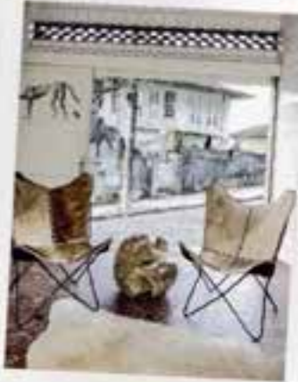
Bar du Design Hotels Project Rio.