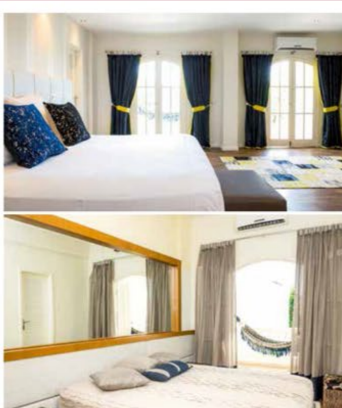
GAMBAR TENGAH: BAWALAH DAKU TERBANG JAUH KE BUMI BRAZIL AGAR DAPAT MERASAI NIKMAT BERMALAM DI SINI. SALAH SEBUAH BILIK TIDUR YANG DIDOMINASI WARNA BUMI NAN SEGAR SEDIA MENANTI KEHADIRAN TETAMU YANG MENDAMBAKAN SUASANA DAMAI SERTA MENENANGKAN.