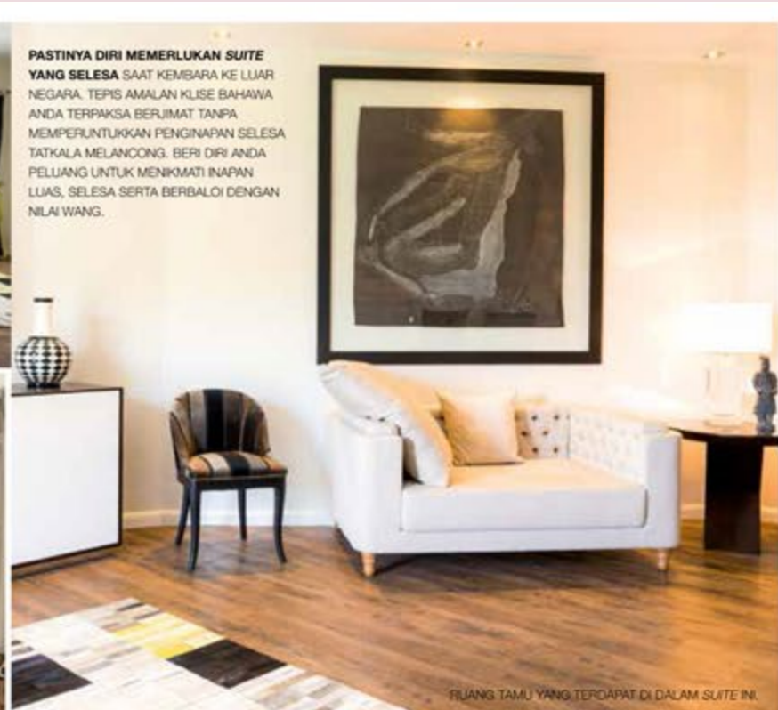
PASTINYA DIRI MEMERLUKAN SUITE YANG SELESA SAAT KEMBARA KE LUAR NEGARA. TEPIS AMALAN KLISE BAHAWA ANDA TERPAKSA BERJIMAT TANPA MEMPERUNTUKKAN PENGINAPAN SELESA TATKALA MELANCONG. BERI DIRI ANDA PELUANG UNTUK MENIKMATI INAPAN LUAS, SELESA SERTA BERBALOI DENGAN NILAI WANG.