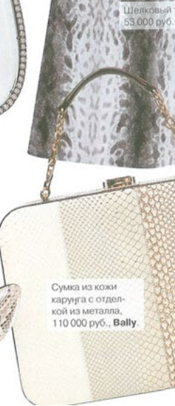
Шелковый топ, 53 000 руб., Sutra.