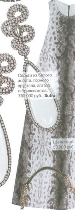
Серьги из белого золота, горного хрусталя, агатов и бриллиантов, 780 000 руб., Sutra.