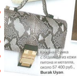
Кожаная сумка с отделкой из кожи питона и металла, около 57 400 руб., Burak Uyan.

УРСУЛА АНДРЕСС Характерная девушка Бонда показала характер, сбежав в семнадцать лет с французским актером из родного тихого Интерлорночного Рима. Беглянку вернул Интерлорноч, но ненадолго. Урсула отправилась прямо в Париж — зубрить пьесы Мольера и танцевать. Однако удача улыбнулась красотке не в городе любви, а в том же Риме. Если бы не полезное и приятное знакомство с сердцеедом и приютное знакомство с сердцеедом Марлоном Брандо, не видать бы Урсуле карьеры в Голливуде, а зрителям — не забываемого выхода из моря в белом купальнике в первом фильме об агенте Ее Величества. Впрочем, в наглухо закрытом платье со змеиным принтом она выглядит не хуже, чем в бикини. — у девушки шпиона не бывает промахов.