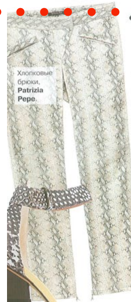
Хлопковые брюки, Patrizia Pepe.