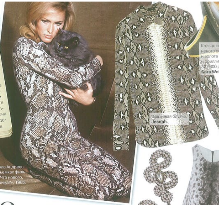
Шелковая блузка Joseph.