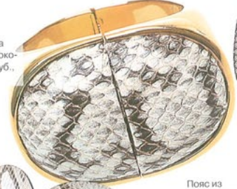
Браслет из кожи питона и металла, около 30 000 руб., Nina Ricci.

Совсем неядовитые узоры кожи редких змей атаковали гардеробы модниц.