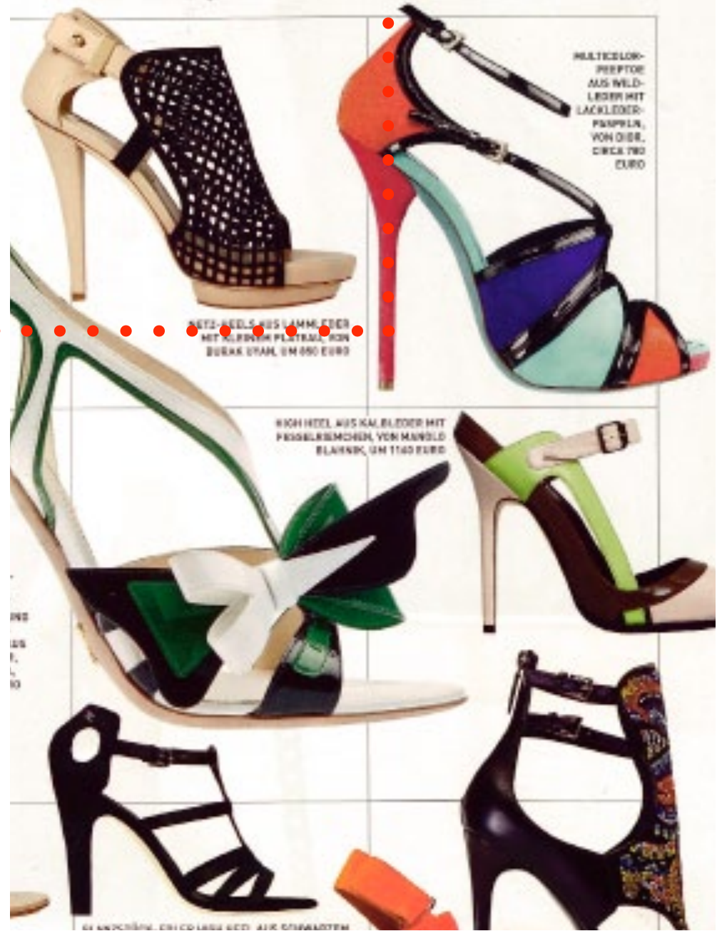
MULTICOLOR- PEPITO AUS WILD- LEDER MIT LACKLEDER- PÄPPEL, VON DIEB, CIRCA 790 EURO

bisschen verspielt und immer sexy und feminin – man möchte alle ha